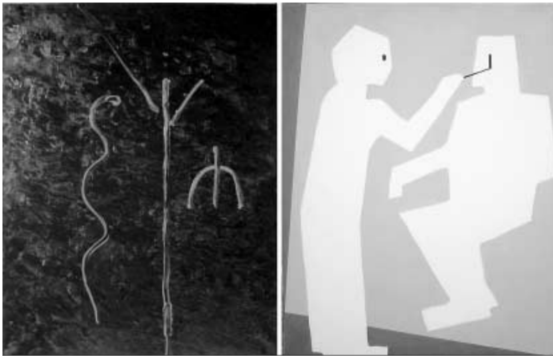
Óleo de Manolo Quejido titulado 'El paraíso y la pintura' que puede verse en la exposición 'Ensayo general'.

En esta exposición de Grazalema, Rivas propone un acercamiento a lo que será la gran muestra que con el título Los Fantasmas de Madrid 1969/2009 está preparando para